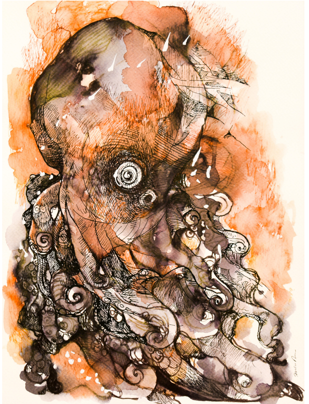
Pleamar Mixta sobre papel 24 x 32 cm