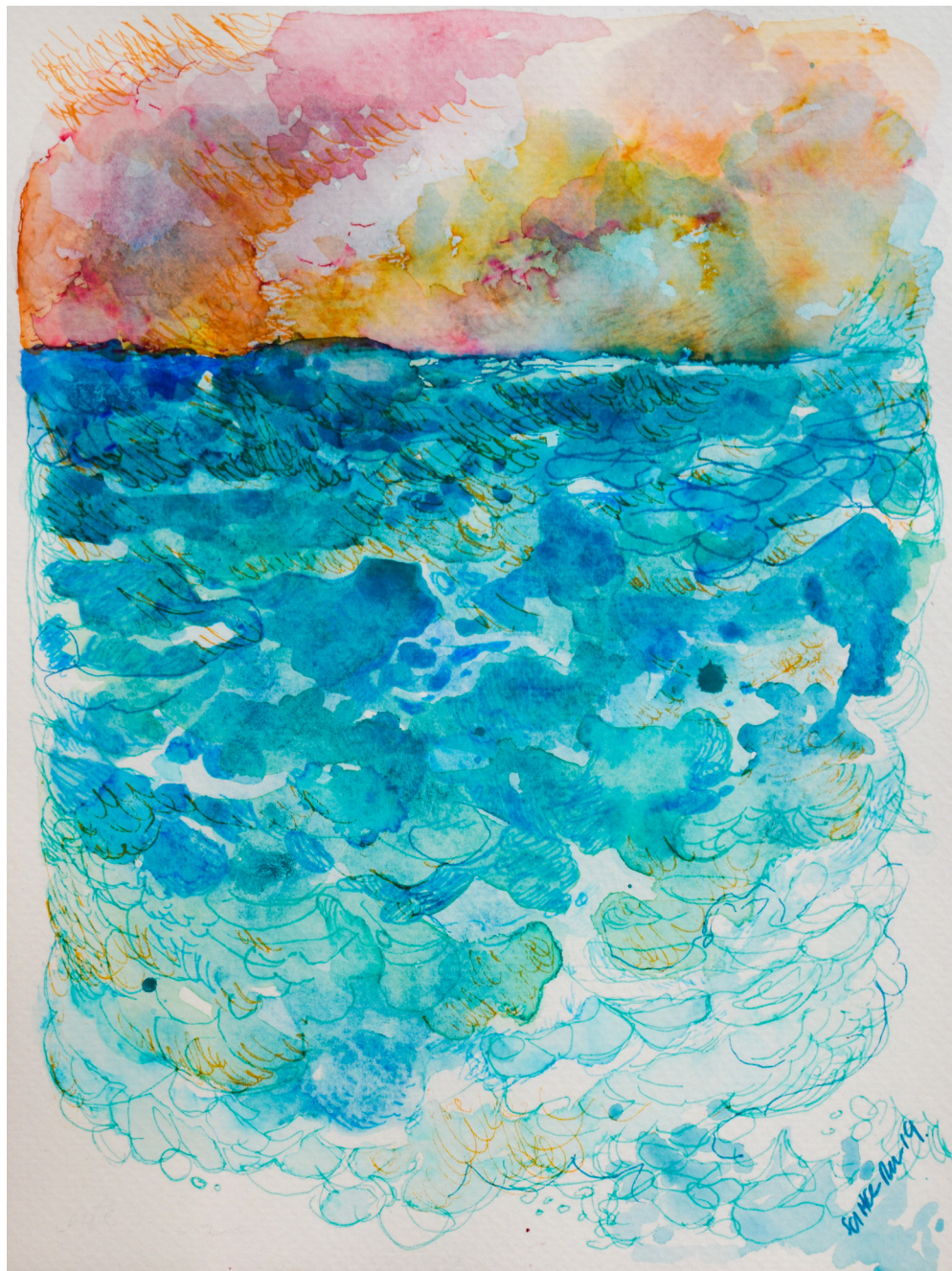
Marea Mixta sobre papel 18 x 24 cm