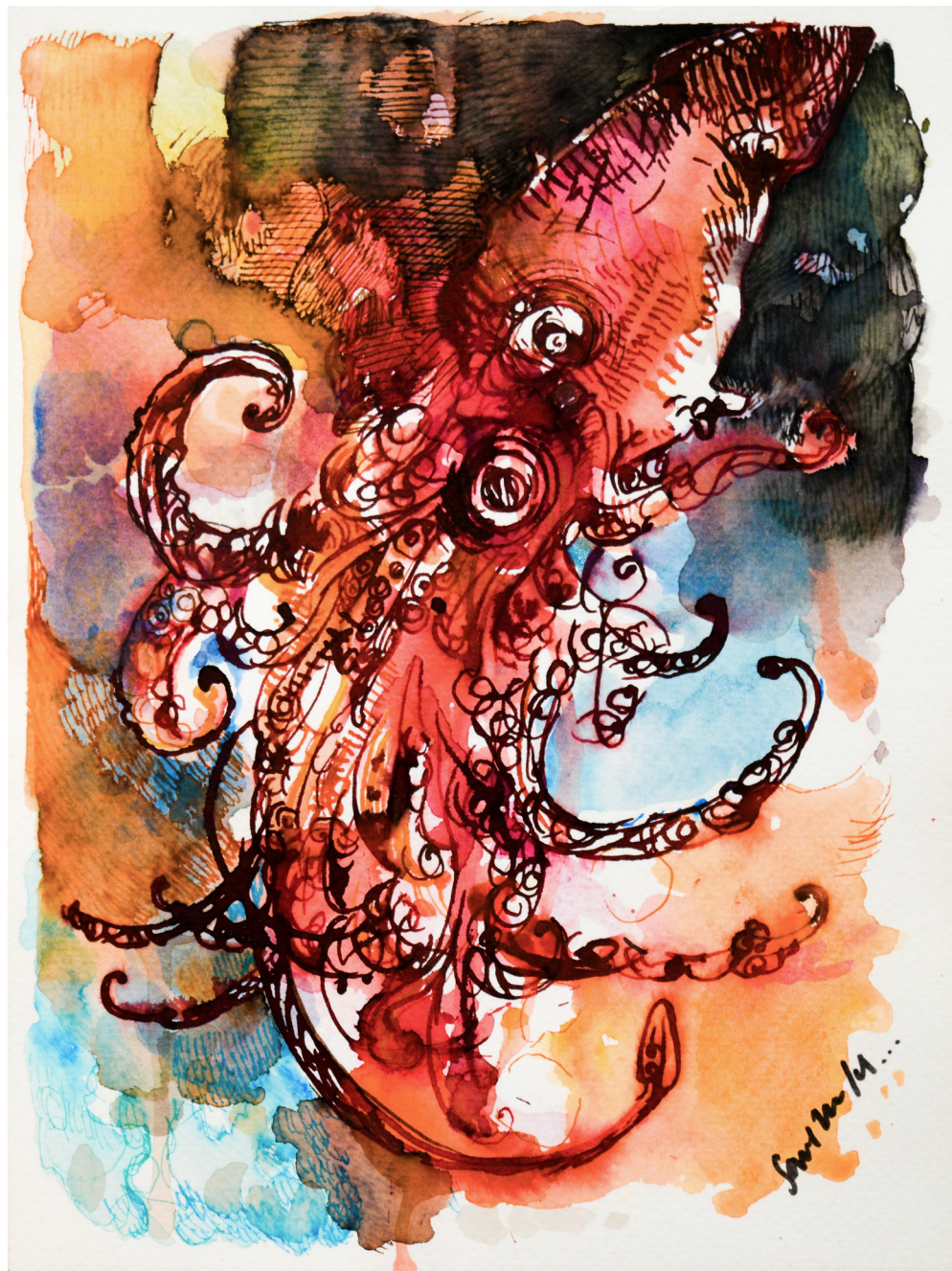
Mergal Mixta sobre papel 18 x 24 cm