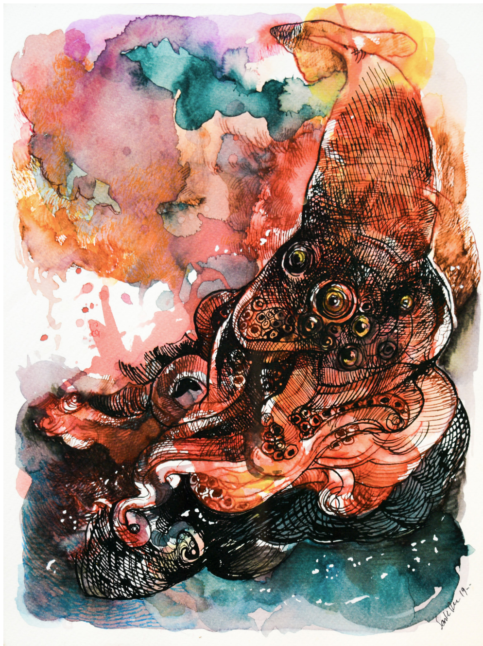
Faro Mixta sobre papel 24 x 32 cm