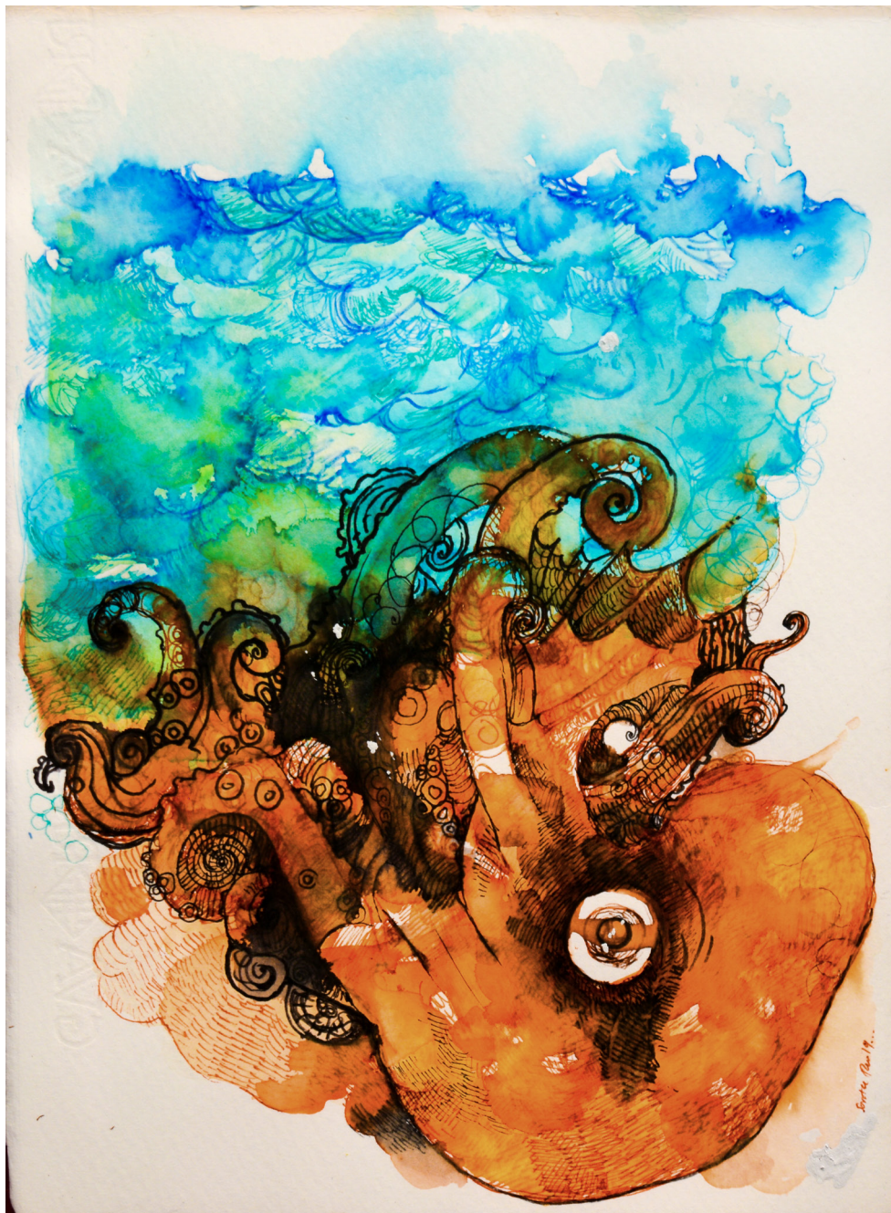
Aguamarina Mixta sobre papel 25 x 34 cm