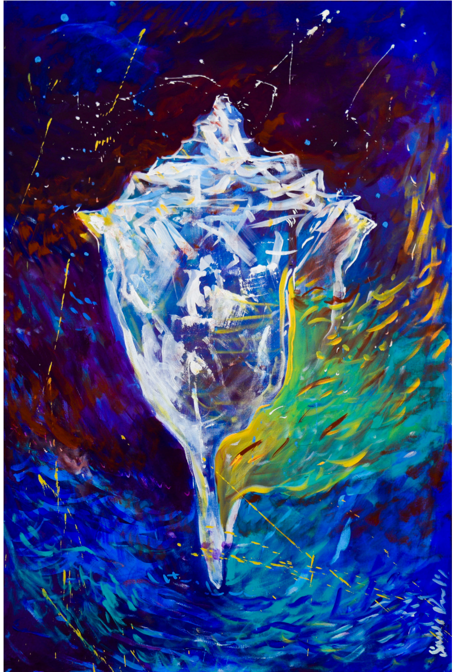
Voces sobre el agua Acrílico sobre tela 60 x 90 cm