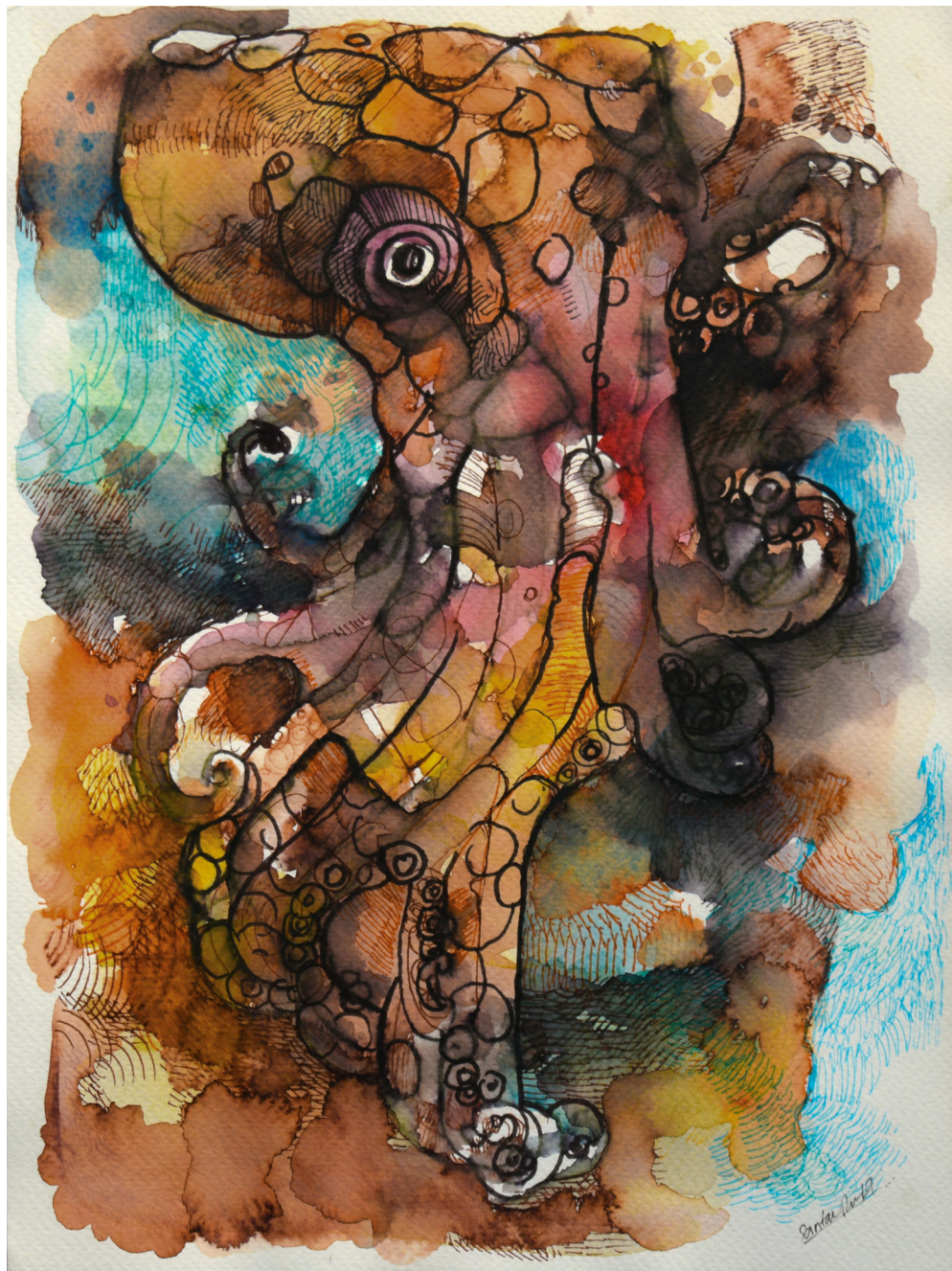
Géminis 2 Mixta sobre papel 24 x 32 cm