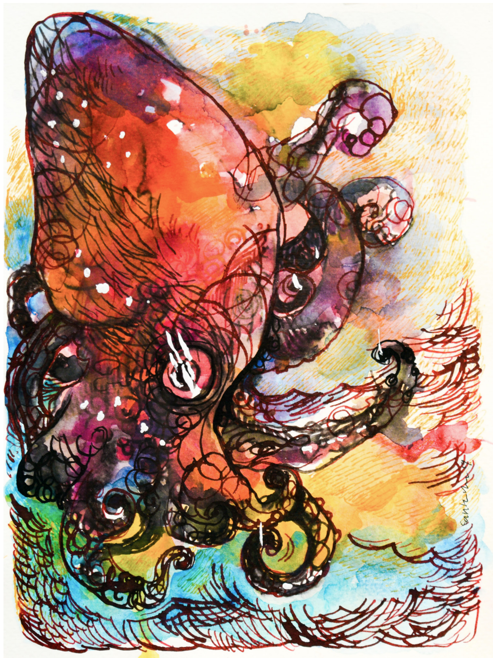
El brujo Mixta sobre papel 18 x 24 cm