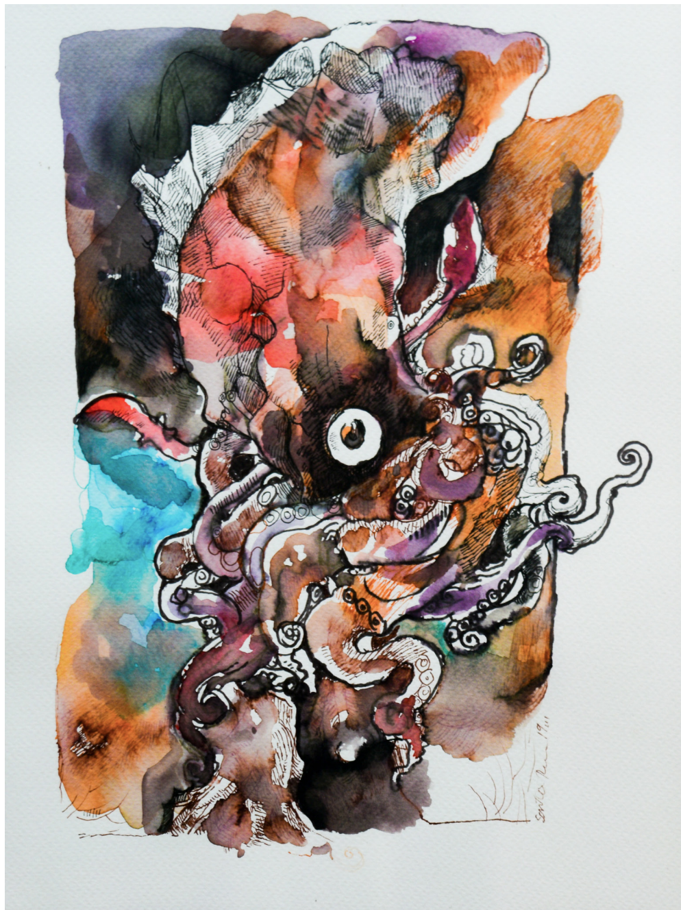
Akumal Mixta sobre papel 24 x 32 cm